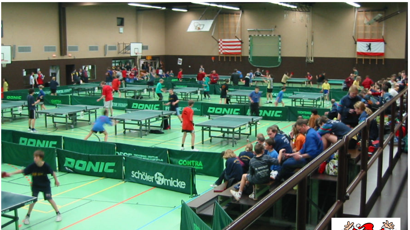
▲ Impression aus dem Westersteder Tischtennis-Jugendturnier 2003